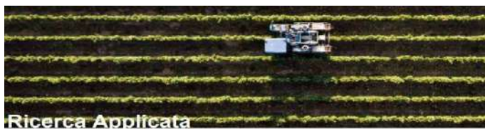
Economia Circolare nel Sistema Agroalimentare Piemontese

zione dei rifiuti. E quindi, identificare e proporre politiche di sistema regionale in funzione degli obiettivi di sostenibilità con riferimento ad ambiti e filiere ritenuti prioritari. I destinatari sono la Regione Piemonte, il sistema delle Università piemontesi e degli Enti di ricerca, i Poli di Innovazione e il sistema produttivo piemontese. Una particolare attenzione è stata dedicata all'individuazione di percorsi di: valorizzazione degli scarti provenienti dal sistema produttivo agro-alimentare; valorizzazione alternativa dei rifiuti solidi urbani. Le fasi della ricerca hanno previsto l'analisi a livello regionale della gestione della frazione organica dei rifiuti attraverso attività di compostaggio industriale