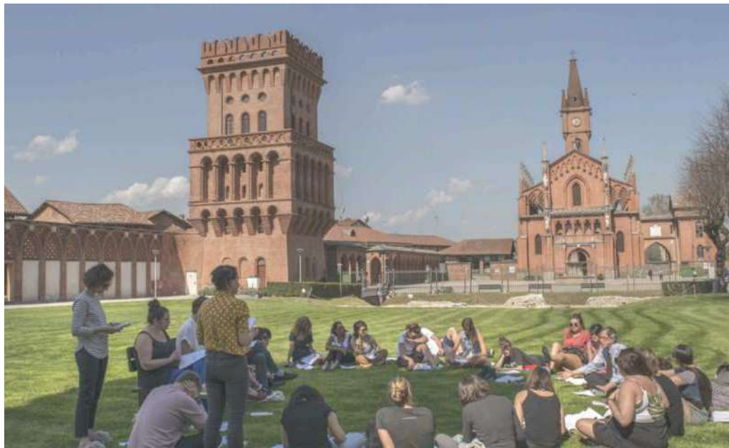
La sede dell'Università di Scienze gastronomiche a Pollenzo (Cn) e in basso, la copertina del report sull'economia circolare

Un documento ricco di spunti, nato da un lavoro di coinvolgimento dei Poli di innovazione, rappresentanti delle filiere, in cui vengono presentate analisi e proposte su come i temi dell'economia circolare possano essere presi in carico. Non mancano poi i suggerimenti per far sì che vengano adottate a livello regionale delle misure dal punto di vista regolamentare e normativo. L'attività è stata volta a identificare, con il coinvolgimento dei principali stakeholder, le problematiche che caratterizzano il sistema piemontese dell'agroalimentare in relazione alla transizione verso un modello di economia circolare basato su un maggior uso di risorse rinnovabili, sul riuso delle materie prime e sulla valorizza-