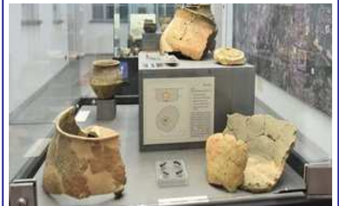
Una sala del museo civico “Federico Eusebio” di Alba

Il Museo è aperto dal martedì al venerdì, dalle ore 15 alle 18; di sabato, domenica e festivi dalle 10 alle 13.00 e dalle 15 alle 19. Ingresso: 3 euro intero; 1 euro ridotto. Info e prenotazioni: museo@comune.alba.cn.it ; 0173-