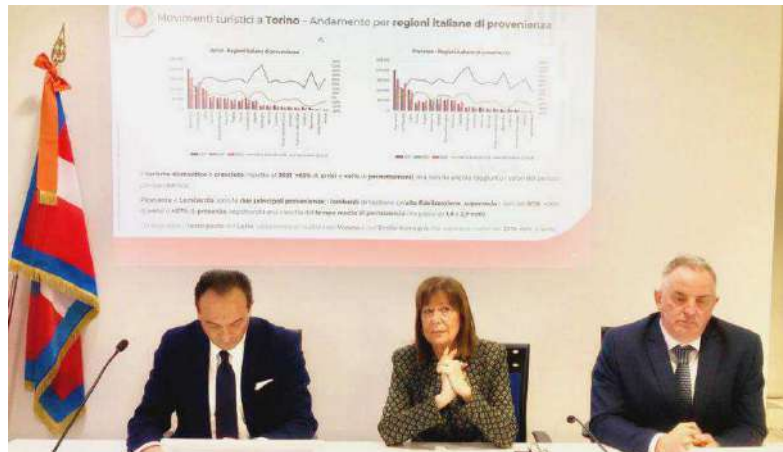
La presentazione dei dati molto confortanti sul turismo piemontese

Fra i dati più rilevanti infatti la crescita dei movimenti dall'estero, con il 49% dei pernottamenti a fronte del 44% del 2019. Per l'80% si tratta di turisti provenienti dai principali mercati europei (Germania, BeNeLux, Francia, Svizzera, Regno Unito, Scandinavia, Spagna) e dagli Usa, che tornano a crescere facendo segnare un +7 sul 2019. Il turismo domestico invece