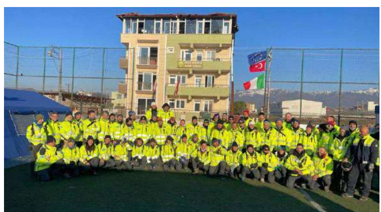
I componenti della missione della Protezione civile piemontese hanno allestito un ospedale da campo in Turchia, ad Antiochia

«L'aiuto che diamo in queste circostanze è sempre straordinario - annota l'assessore regionale alla Protezione civile Marco Gabusi -. Sono molto grato a tutti i volontari che hanno scelto di partire per la Turchia e portare il loro bagaglio di conoscenza