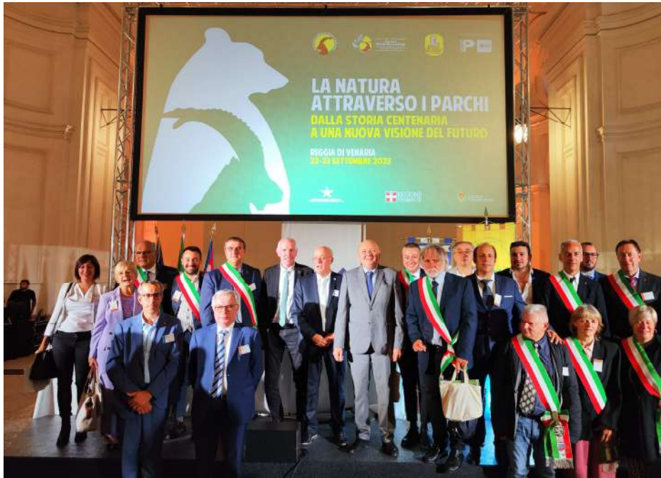
I partecipanti alla giornata inaugurale delle celebrazioni dei 100 anni dei Parchi nella Sala Citroniera della Reggia di Venaria e, sotto, uno dei tavoli tematici

Il pubblico delle grandi occasioni ha partecipato alle iniziative organizzate dal 22 al 24 settembre alla Reggia di Venaria e nel Parco regionale La Mandria, per le celebrazioni conclusive dei cento anni dei Parchi nazionali del Gran Paradiso e d'Abruzzo, Lazio e Molise e dei quarant'anni della rivista Piemonte Parchi. Convegni, seminari, visite guidate, concerti, e tante attività all'aperto si sono svolte fra la residenza sabauda,