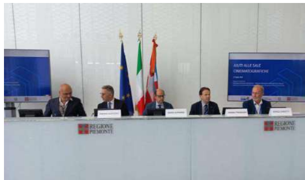
La presentazione del bando, gestito da Finpiemonte