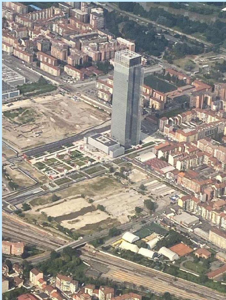
La sede della Regione Piemonte, nel nuovo Grattacielo di via Nizza 330 a Torino

Per poter svolgere al meglio le funzioni assegnate, l'Orecol ritiene infatti utile «instaurare un rapporto di collaborazione anche con gli enti locali e con i cittadini che avranno la possibilità di segnalare eventuali criticità nell'ambito delle aree di intervento assegnate all'organismo stesso».