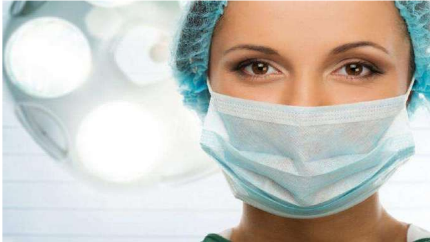
Nel 2023 verranno stanziati dalla Regione i primi 25 milioni di euro

Le 2.000 nuove assunzioni di personale a tempo indeterminato saranno in una parte da definire con la dirigenza medica, al netto del percorso specifico per gli specializzandi. L'operazione prevede lo stanziamento di 25 milioni già nel 2023, e poi per il 2024, 2025 e 2026 di 50 milioni all'anno di coperture finanziarie aggiuntive per le aziende sanitarie che la Regione è in grado di assicurare con il Fondo per lo sviluppo e coesione. In particolare, all'interno della prossima programmazione 2021-2027 dei fondi Fsc la Regione ha presentato al Governo un piano che prevede di destinare 175 milioni al potenziamento della sanità territoriale, che permetterà alle aziende sanitarie di liberare nei propri bilanci ri-