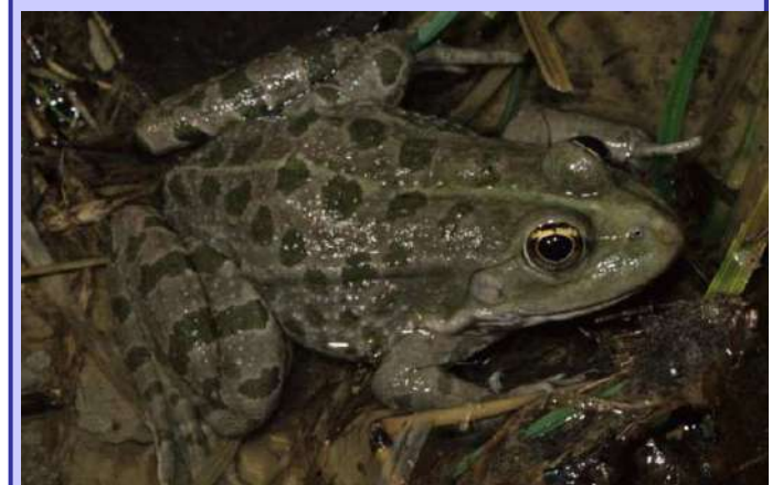
In alto, un esemplare di rana toro. Qui sopra, una rana verde dei Balcani