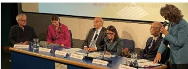
Alcuni momenti della presentazione della Relazione sullo stato dell'ambiente e l'evento di CinemAmbiente

In questo scenario la Regione Piemonte, come sottolineato dall'assessore all'Ambiente Matteo Marnati, ha messo in campo una serie di iniziative importanti: dalla revisione dei principali Piani e Programmi con valenza ambientale che riguardano le acque, l'energia, i rifiuti, alla messa a punto delle strategie regionali, come quelle per lo sviluppo sostenibile e l'adattamento climatico. Notevole anche l'utilizzo di risorse finanziarie, anche attraverso la pubblicazione di numerosi bandi che investono sull'ambiente della regione, favorendo ad esempio la messa in servizio di mezzi pubblici ecologici e la rottamazione di veicoli commerciali inquinanti o destinando risorse per chi deve sostituire stufe per riscaldamento di vecchia generazione.