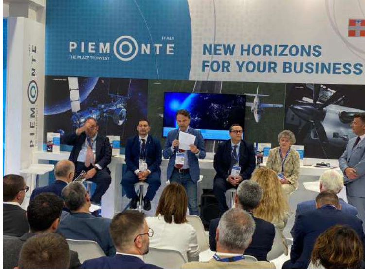
Il sistema piemontese dell'aerospazio presente in Francia sino al 25 giugno, al Paris Air Show