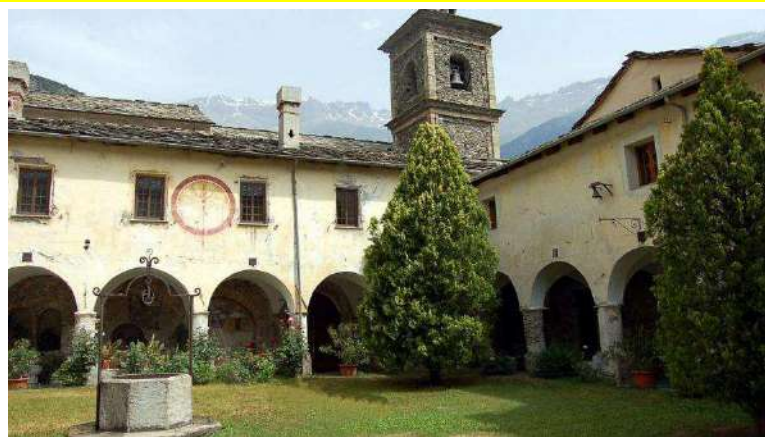
L'Abbazia di Novalesa. Verranno restaurati degli affreschi

Per il presidente e l'assessore alla Cultura della Regione