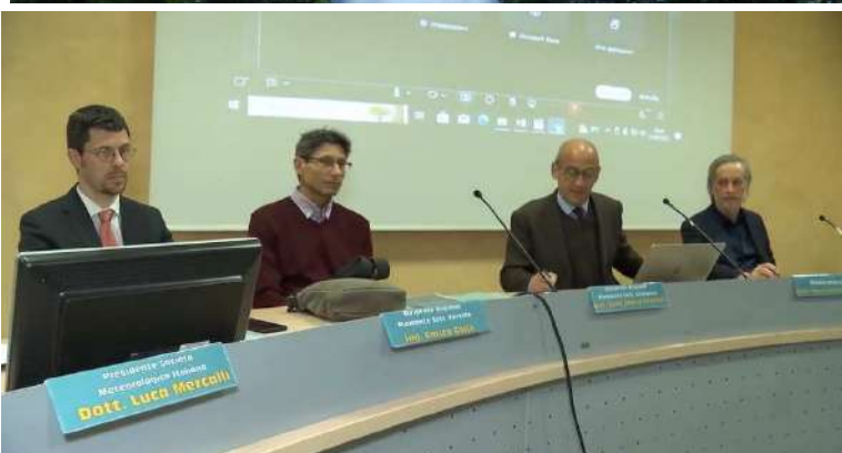
La locandina ed un momento del convegno

nizzato in occasione delle due ricorrenze il convegno "Giornate internazionali delle foreste e dell'acqua: il ruolo della gestione forestale nei processi idrologici e di assetto idrogeologico del territorio", in sinergia con il Comando Carabinieri forestali e la federazione Ordini dottori agronomi e forestali Piemonte e Valle d'Aosta. Tra i relatori del convegno Luca Mercalli, presidente della Società meteorologica italiana, che ha illustrato gli scenari causati dal riscaldamento globale per le nostre foreste. Il cambiamento climatico ci chiede da un lato di ripensare ad alcuni usi del territorio e dall'altro mette in luce fragilità e criticità che devono essere sempre attentamente considerate. Dobbiamo lavorare molto, tutti insieme, per affrontare una situazione complessa che richiede