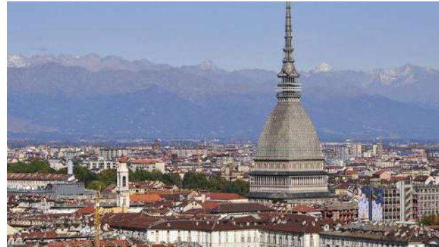
Torino ed il Piemonte si sono candidate per ospitare la sede dell'Autorità Europea Antiriciclaggio

Regione Piemonte e Comune di Torino hanno trasmesso formalmente al Governo il dossier di candidatura di Torino come sede dell'Autorità europea Antiriciclaggio. Il comitato promotore (presieduto dal magistrato Alberto Perduca, ex procuratore aggiunto di Torino e procuratore di Asti con elevate competenze in materia di antiriciclaggio) è composto, oltre che dal presidente della Regione Piemonte e dal sindaco di Torino, anche da Gian Carlo Caselli nel ruolo di "special advisor".