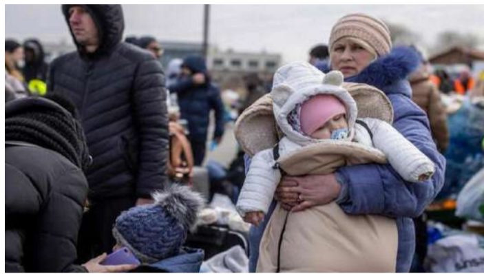
Il Piemonte si organizza per aiutare i profughi dall'Ucraina