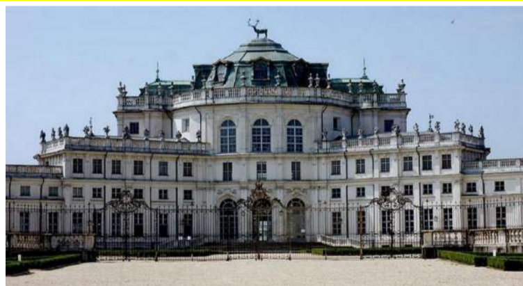
Stupinigi al centro di un progetto di valorizzazione culturale

Sarà il ministero della Cultura, nell'ambito dei nuovi progetti di valorizzazione culturale che il Governo promuoverà nel 2022, a finanziare il rilancio del complesso monumentale di Stupinigi, Patrimonio dell'Unesco, con la Palazzina di Caccia e il borgo che la circonda. La disponibilità è stata espressa dal ministro della Cultura Dario Franceschini durante un incontro in videocollegamento