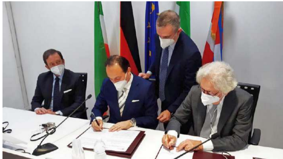
La firma è avvenuta nel Palazzo della Regione Piemonte, a Torino

A siglare il documento e ad illustrarne i contenuti sono stati, lunedì