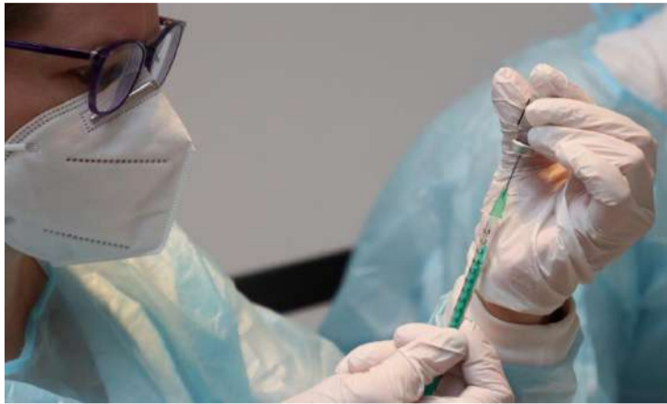
Anche per le professioni con obbligo vaccinale, l'accesso è diretto

Accesso diretto per le professioni con obbligo vaccinale. Chi rientra nelle professioni con obbligo vaccinale (personale del comparto sanitario e socio-assistenziale, personale scolastico e universitario, forze dell'ordine, del comparto difesa, sicurezza e soccorso pubblico) può effettuare l'accesso diretto in alcuni degli hub delle Asl piemontesi per la prima, seconda e terza dose.