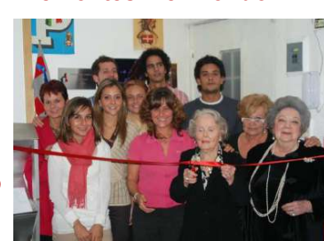
La carica dei Piemontesi in Messico