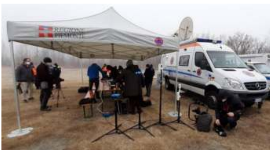
L'esercitazione Faster svoltasi ad Avigliana ha visto impegnate 131 addetti

L'esercitazione è stata organizzata dal settore