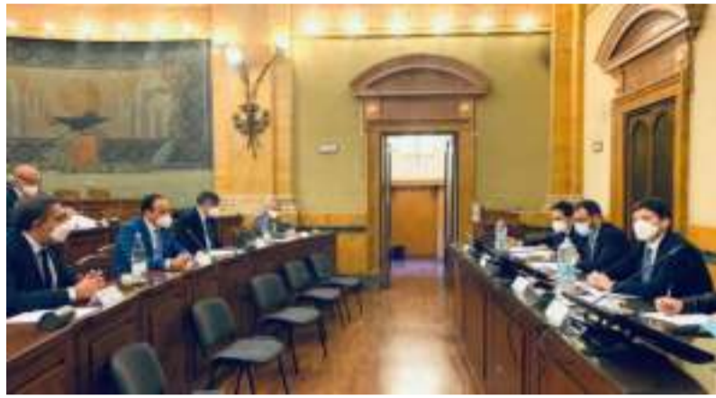
L'incontro tra i presidenti di Piemonte e Liguria con il Governo