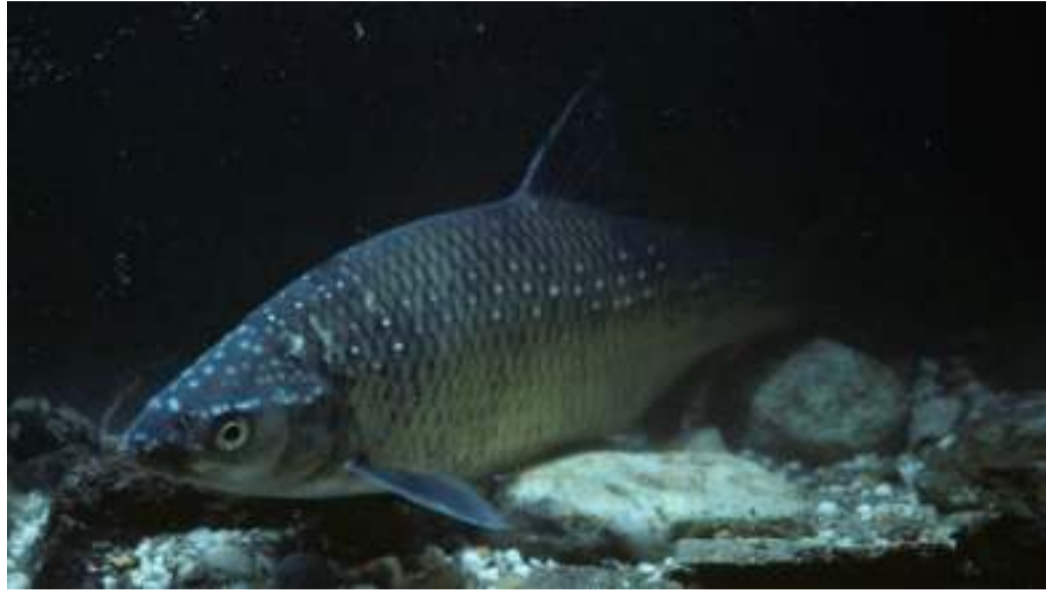
In alto, primo piano di pigo adagiato sul fondo sabbioso; in basso, la locandina dell'Anno internazionale della pesca e dell'acquacoltura 2022 dell'Onu

Gli strumenti e le iniziative messe in campo dalla Regione Piemonte