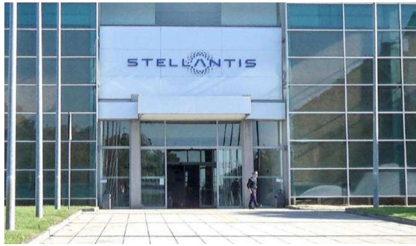
Incontro dell'ad di Stellantis, Carlo Tavares, con le istituzioni locali

È stato positivo e concreto l'incontro che il presidente della Regione Piemonte e il sindaco di Torino hanno avuto con l'amministratore delegato di Stellantis, Carlos Tavares, e altri dirigenti dell'azienda: sono stati infatti annunciati investimenti strategici per la realizzazione a Mirafiori del primo centro europeo del Gruppo dedicato all'e-