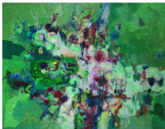
DIVINE ASTRAZIONI COLLEZIONI DI INFORMALE

È stata inaugurata il 17 settembre al Civico Museo Archeologico di Acqui Terme (Castello dei Paleologi) la Mostra Antologica dal titolo "Divine Astrazioni. Collezioni di Informale", a cura di Laura Garbarino e Paolo Repetto, organizzata dal Comune di Acqui Terme, ideata e promossa dall'Associazione ComitArt. La mostra, che sarà aperta fino al prossimo 6 novembre, propone 30 opere, di pittura e scultura, di 28 autori provenienti da collezioni private del nord Italia, appartenenti all'Informale, il movimento artistico del dopoguerra che si presenta come ribellione ad ogni forma, figurativa o geometrica, conseguente alla distruzione morale e fisica relativa ai conflitti. Per gli allievi delle scuole di ogni ordine e grado è previsto l'ingresso gratuito nella giornata di giovedì per l'intera durata della mostra. Questa Mostra si aggiunge al Premio Acqui Storia e al Premio Acqui Ambiente, nella promozione della città di Acqui Terme quale polo culturale d'eccellenza. Per un mese e mezzo negozi ed esercizi commerciali hanno aderito alle iniziative di promozione esponendo materiali o citazioni che richiamano i contenuti dell'esposizione. Divine Astrazioni. Collezioni di Informale sarà aperta dal lunedì al venerdì con orario 10 - 13 e 16 - 20, il sabato e la domenica con orario continuato 10 - 20.