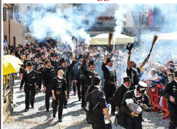
Al Raduno Internazionale sono intervenuti ben mille spazzacamini da tutta Europa e dagli Usa, con 25 mila spettatori

La valle Vigezzo e Santa Maria Maggiore (Vco) sono tornate ad essere la "culla" degli "uomini in nero", protagonisti dell'edizione numero 39 del Raduno Internazionale dello Spazzacamino, andato in scena domenica 4 settembre. Giornata dai grandi numeri: 25 mila spettatori hanno assistito infatti all'evento, atteso da due anni dopo lo stop imposto dal Covid; mille spazzacamini presenti alla sfilata, provenienti da tutta Europa (13 anche dagli Stati Uniti) e ben 20 delegazioni straniere (le più consistenti da Germania, Svizzera, Danimarca, Svezia e