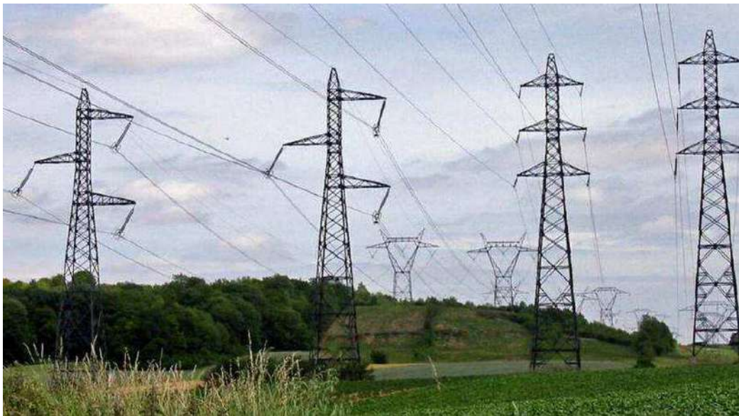
Inviare al Governo richieste sul tema dei costi energetici, per tutelare imprese e famiglie

Nel documento, il presidente e l'assessore alle Attività produttive sostengono la necessità di un doppio tipo di intervento: misure urgenti di cui si possa avere una ricaduta subito per affrontare questo momento di estrema difficoltà, perché ne va della tenuta economica del Paese, e strumenti di medio e lungo periodo che diano una prospettiva di stabilità a imprese e cittadini, perché, esattamente come avvenuto con il Covid, questa emergenza ha accelerato le conseguenze di decenni di gestione sbagliata del tema energia. Tra le richieste del Piemonte al Governo figurano: definire degli stock di energia a prezzo calmierato (tenendo come riferimento il 2020) da mettere a disposizione del sistema produttivo in funzione di dimensione, settori, consumi e fatturato; uno sconto in bolletta con i fondi degli extra profitti, in quanto la produzione di energia è generata in percentuali importanti anche da fonti rinnovabili ma il prezzo che paga l'utente finale è interamente tarato sul valore del gas; facilitare gli impianti per l'autoconsumo nell'