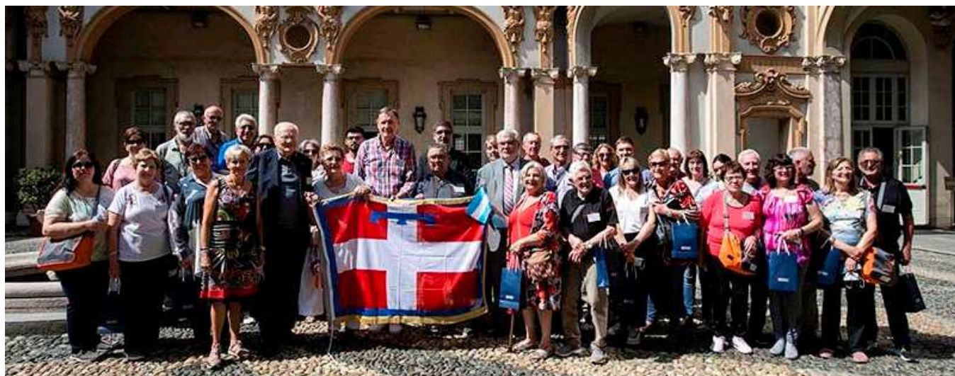
La folta delegazione guidata dalla Fapa, Federazione delle Associazioni dei Piemontesi d'Argentina, nel cortile di Palazzo Lascaris a Torino, dopo l'intenso e commovente incontro con le autorità regionali, avvenuto in Sala Viglione

Tra le tappe al Raduno dello Spazzacamino ed al Museo di Frossasco sono stati ricevuti a Palazzo Lascaris