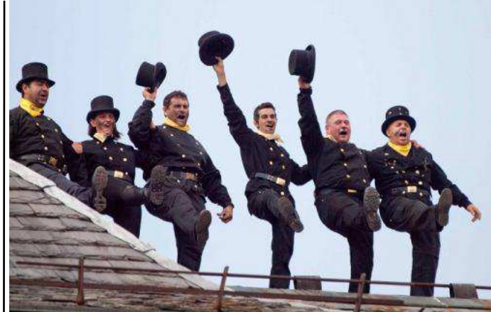
Suggestivo evento a Santa Maria Maggiore (Vco)

Un successo, dopo due anni di pausa pandemica