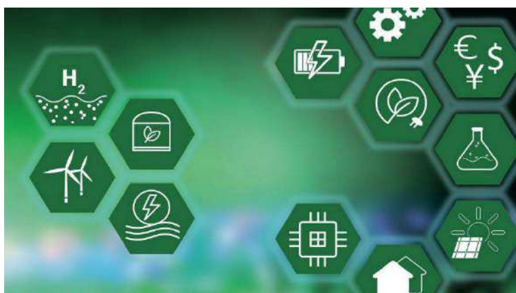
Il protocollo sulle energie alternative è stato siglato a Palazzo Chigi

Al momento della firma il presidente del Consiglio ha dichiarato che con questi progetti si vogliono realizzare siti di produzione di idrogeno verde in aree industriali dismesse, si contribuisce a stimolare la crescita e ci avvicina agli obiettivi energetici e climatici che il Governo è determinato a mantenere e anzi a perseguire con sempre maggiore convinzione. Si inizierà in particolare dalla riconversione di aree industriali dismesse da utilizzare per la produzione di idrogeno. Il protocollo punta pertanto a creare un coordinamento per lavorare in sinergia valorizzando le specializzazioni delle cinque Regioni capofila, che potranno essere messe a servizio dell'intero Paese come esempi da seguire. In questo ambito il Piemonte intende valorizzare la propria eccellenza nei settori della mobilità sostenibile pubblica e privata e della ricerca e sviluppo di modelli produttivi innovativi sostenibili. Un risultato che ha portato il presidente della Regione a sottolineare che l'accoglimento della candidatura vuol dire investimenti prioritari del Pnrr, recupero di aree industriali dismesse, nuova occupazione a chi perderà il lavoro con la transizione dal motore termico a quello elettrico, rispetto dell'ambiente e un Piemonte che ritorna protagonista nelle politiche industriali dell'Italia. L'obiettivo è portare sul territorio una prima parte di 70 milioni di risorse del Pnrr sulle varie linee di finanziamento che riguardano