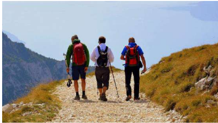
Rinnovata la collaborazione tra Regione Piemonte e Cai

Regione Piemonte e Gruppo regionale Piemonte del Club Alpino Italiano hanno rinnovato la collaborazione firmando un protocollo d'intesa che si propone di valorizzare e promuovere il patrimonio naturale, culturale e paesaggistico delle montagne e sviluppare forme eco-compatibili di gestione e di sviluppo del turismo montano, compreso l'utilizzo delle tecnologie digitali.