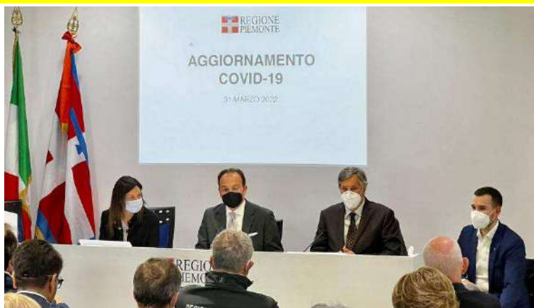
Conferenza stampa in Regione sulla fine dello stato di emergenza

«È un momento che viviamo tutti con grande partecipazione emotiva, attendevamo questa giornata da tempo e vogliamo viverla nel senso più corretto del suo significato: da una parte gioire per la fine dell'emergenza, dall'altra non pensare che il Covid sia stato cancellato dalla nostra vita per decreto. In Piemonte abbiamo attualmente l'incidenza più bassa d'Italia, ma non dobbiamo abbassare la guardia. I dati ci dicono che la situazione è