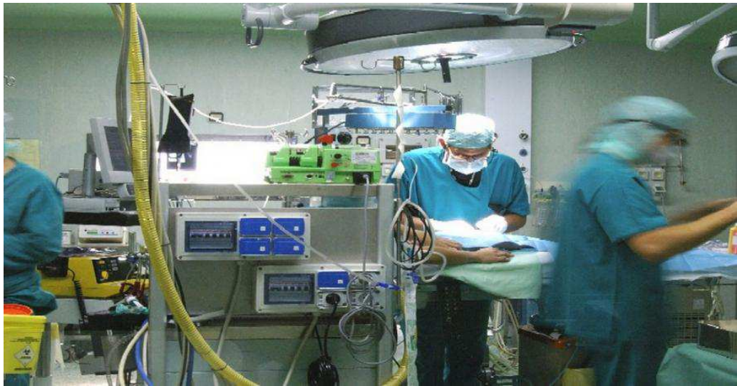
Piano straordinario per ridurre le liste di attesa nella sanità avviato dalla Regione Piemonte

«Quello delle liste d'attesa non è un tema che nasce oggi, si trascina da quasi 10 anni, ma è fondamentale risolverlo ed è ciò che ci impegniamo a fare, consapevoli anche delle conseguenze provocate da due