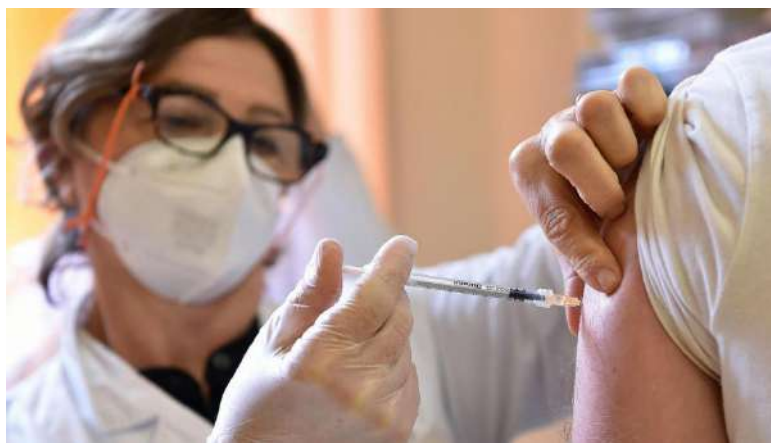
Per le preadesioni alle vaccinazioni occorre utilizzare il portale www.ilPiemontevaccina.it

Caregiver. Potranno manifestare l'adesione alla vaccinazione anche i caregiver, ovvero coloro che convivono con pazienti