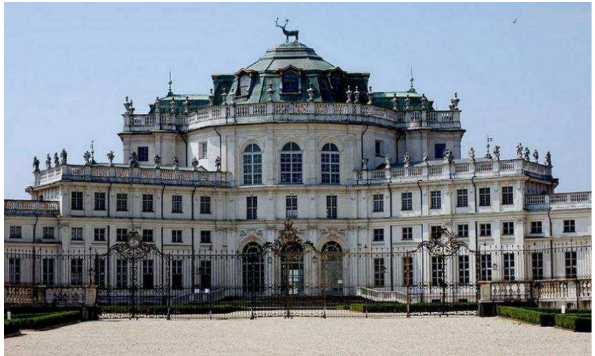
La Palazzina di Caccia di Stupinigi

L'investimento previsto è di 25 milioni di euro, 20 nell'ambito del Pnrr e 5 della programmazione del Fondo europeo di sviluppo regionale: sarà proposto al Ministero della Cultura con l'obiettivo di non frammentare le energie di queste risorse, concentrando in un grande intervento dalle ricadute storiche per l'intero territorio piemontese e italiano. «Stupinigi 2030 mira alla creazione di una seconda Venaria capace di attrarre milioni di visitatori e di un sistema in grado non solo di competere, ma anche di superare per qualità e attrattività i Castelli della Loira - sostiene il presidente della Regione Piemonte Alberto Cirio con gli assessori alla Cultura e Turis-