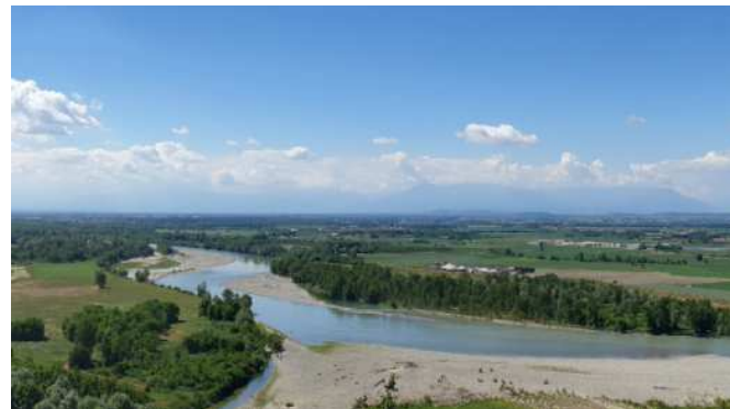
Uno scorcio del Parco del Po piemontese e, sotto, il bosco Pastrona a Casale Monferrato

«Non è la prima volta che capita. Dal 1996 andiamo a piantare gli alberi per i rimboschimenti lungo il fiume e la mattina dopo