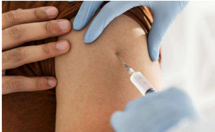
Terza dose. Immunodepressi, fragili e over80 verranno convocati dalle Asl

«Nelle ultime 24 ore l'intera macchina vaccinale piemontese ha fatto un enorme lavoro organizzativo per potenziare le agende e consentire così di aumentare gli spazi disponibili per fissare nuovi appuntamenti, alla luce di una platea di oltre 1,2 milioni di persone che in Piemonte ha già maturato i 5 mesi dal completamento del ciclo vaccinale primario - sottolineano il presidente della Regione Alberto Cirio e l'assessore alla Sanità Luigi Genesisio Icardi, insieme al com-