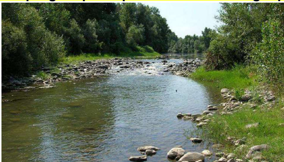
Il torrente Orba

Nello specifico riguardano le fasce boscate agroforestali lungo il torrente Scrivia, la riqualificazione dell'ecosistema fluviale dell'Orba da Casal Cermelli a Rocca Grimalda, la riqualificazione delle sponde del canale Roggia Molinara con un approccio innovativo che permetta di mantenerne il valore ecologico, il ripristino degli ambienti umidi perfluviali e l'apertura di nuovi rami fluviali, il miglioramento della biodiversità del lago d'Orta con il ripristino del canneto, il miglioramento della vegetazione lungo le sponde di fiumi nei centri urbani di Santo Stefano Belbo, Canelli, Venaria e Villafranca Piemonte. A renderlo noto è stato l'assessore all'Ambiente Matteo Marnati aprendo i lavori del webinar "Programma di interventi su fiumi e laghi. Esiti anno 2021 e lancio bando