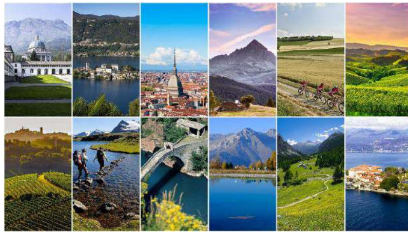
Dati positivi per il turismo in Piemonte durante l'estate scorsa

"Il turismo estivo 2021 in Piemonte è stato caratterizzato da un grande ritorno degli stranieri, soprattutto con tedeschi, con olandesi, scandinavi e francesi - ha riferito con soddisfazione Cirio -. Sono dati che ci fanno molto ben sperare per il futuro: avevamo tutti paura e invece sono molto positivi e significativi. Inoltre, dato che sul turismo vogliamo investire attenzione e risorse, rappresentano una cartina di tornasole che ci deve aiutare ad impostare al meglio l'attività per il futuro".