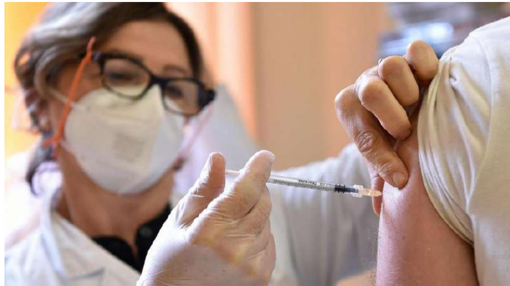
Sul www.regione.piemonte.it l'elenco dei centri vaccinali che garantiranno l'accesso diretto

Al momento, tra chi ha aderito nella fascia 12-19 anni il 94% ha già ricevuto la prima dose, mentre ha già completato il ciclo vaccinale quasi il 70% dei 16-19enni e il 37% dei 12-15enni.