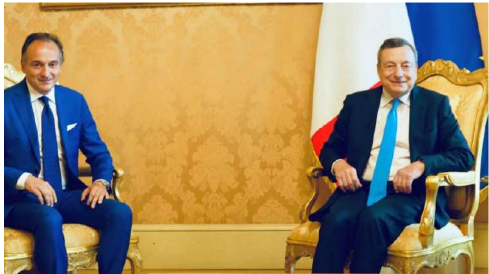
Piemonte e Torino sono stati la prima Regione, con il capoluogo, ricevuti dal premier per trattare del futuro industriale ed economico del nostro Paese

Un dossier che inquadra la situazione economica, produttiva e occupazionale di Torino e del Piemonte, ma anche le sue eccellenze e progettualità per un futuro che passa da automotive, elettrico, idrogeno, aerospazio e intelligenza artificiale è stato consegnato nel corso dell'incontro con il presidente del Consiglio Mario Draghi che il presidente