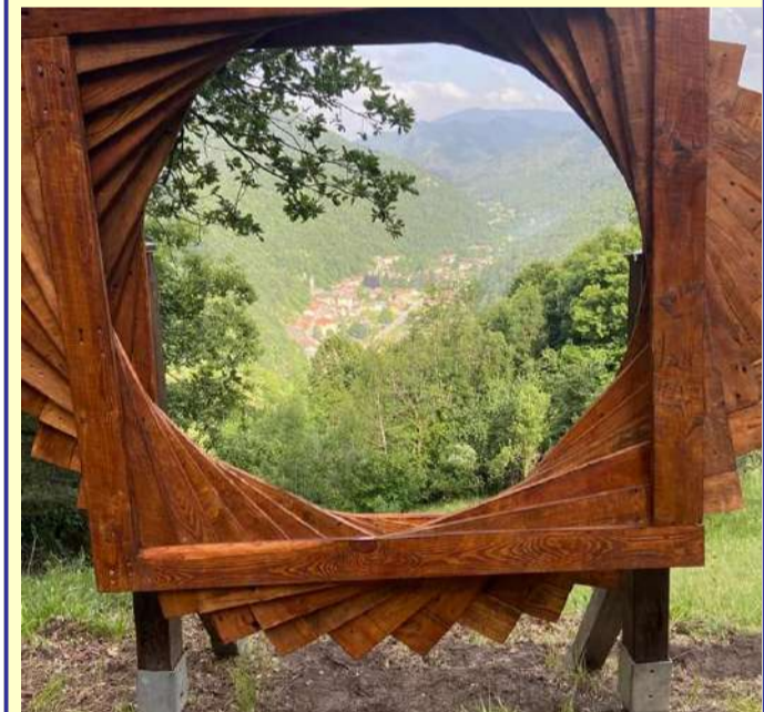
Un'installazione artistica lungo il cammino

A Pradleves, in alta Valle Grana, con un'opera di volontariato compiuta dai cittadini, è stato realizzato il "Sentiero delle leggende". Il percorso, che riprende cammini ultracentenari, ripuliti dai volontari, si perde nei tanti racconti che affondano le loro radici nelle tradizioni della valle. Percorrendolo, si troveranno le tracce e si potranno evocare storie di orchidee malvagie, uomini dalla forza incredibile, streghe malefiche, silvani benevoli, lupi sciocchi e volpi astute. Lungo il "Sentiero delle leggende" si possono ammirare panorami sulla valle Grana, boschi fitti, prati, cappelle campestri, grotte, frazioni, ma anche installazioni artistiche, animali e grandi e imponenti faggi. Il tracciato è per escursionisti e prevede tre versioni con diversi dislivelli e tempi di percorrenza. Per ulteriori informazioni, consultare www.facebook.com/ilsentierodelleleggende