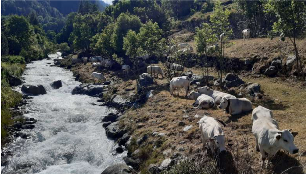
Vacche al pascolo a Balme, durante la stagione estiva. Sotto, uno scorcio del Pian della Mussa a monte dell'abitato di Balme, durante la stagione invernale

Balme, il più piccolo ed elevato paese delle valli di Lanzo, per primo in Piemonte è stato accolto nel circuito dei "Villaggi degli Alpinisti" (Bergsteigerdorfer). La candidatura era stata promossa due anni fa dal Cai, tramite l'Unione delle Sezioni del Canavese, Valli di Lanzo. La selezione dei "Villaggi degli Alpinisti" avviene attraverso precisi criteri d'ammissione, come la presenza di scenari ricchi di fascino, ambienti di interesse alpinistico e paesaggi culturali e naturali intatti. Tra i requisiti, ha particolare rilevanza anche la volontà e l'impegno delle comunità locali di perseguire uno sviluppo turistico sostenibile in termini ambientali e sociali. Il progetto dei "Villaggi degli Alpinisti" è stato lanciato con successo anni fa in Austria, da dove si è poi sviluppata una rete europea di 35 località, immerse in una natura incontaminata.