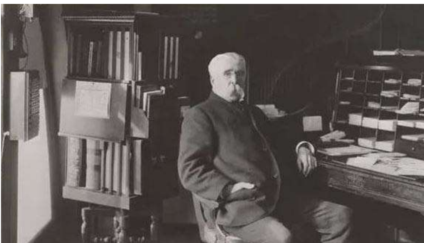
Generale, archeologo, direttore del Metropolitan Museum di New York: due mostre celebrano Luigi Palma di Cesnola (1832-1904)

Rivarolo Canavese, nel Torinese, sta celebrando con la mostra "Sinceramente Vostro, Luigi Palma di Cesnola" il suo illustre concittadino, piemontese nel mondo, che nel 1876 diventò il primo direttore del Metropolitan Museum, a New York. Con le sue ricerche archeologiche, contribuì a fare di Cipro una meta unica nel panorama delle antiche civiltà del Mediterraneo. Nato nel centro canavese il 28 giugno 1832, Luigi Palma di Cesnola morì a New York il 20 novembre 1904: discendente da una famiglia nobile piemontese, partecipò attivamente alla vita militare, a partire dalla Prima Guerra d'Indipendenza e fino a quella di Crimea. Lasciato il Piemonte nel 1858 alla volta degli Stati Uniti, partecipò come ufficiale alla Guerra di Secessione nell'esercito nordista, raggiungendo il grado di generale. Divenne il primo italiano ad essere insignito della Medal of Honor, la più alta decorazione militare assegnata dal Governo degli Stati Uniti. Fu quindi console degli Stati Uniti a Cipro (1865-77), dove attuò una serie di importanti campagne di scavi archeologici, che portarono al rinvenimento di numerosi reperti di arte fenicia, assira, egizia, greca e romana. Nel 1870 realizzò un catalogo scientifico