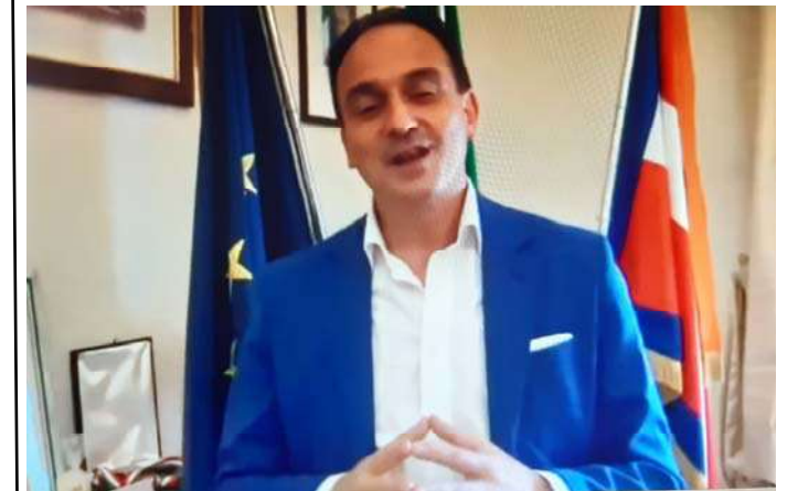
Il saluto del presidente della Regione Piemonte, Alberto Cirio

Il saluto del presidente della Regione Piemonte, Alberto Cirio, all'assise della Federazione delle associazioni dei Piemontesi in Argentina si è concluso in lingua piemontese, con la parlatella della sua terra d'origine, l'Albese: «Grazie della vostra amicizia, della vostra forza, grazie di essere piemontesi, grazie perché il Piemonte ha il cuore grande e nel cuore del Piemonte ci siete voi, piemontesi nel mondo».