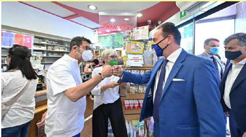
Il presidente Alberto Cirio al via delle vaccinazioni in farmacia

Sono iniziate venerdì 18 giugno le vaccinazioni anche in 320 farmacie piemontesi, che nei prossimi giorni saranno seguite da altre 200. È partita così, dopo la messa a punto della complessa macchina organizzativa, l'applicazione dell'accordo raggiunto da Regione