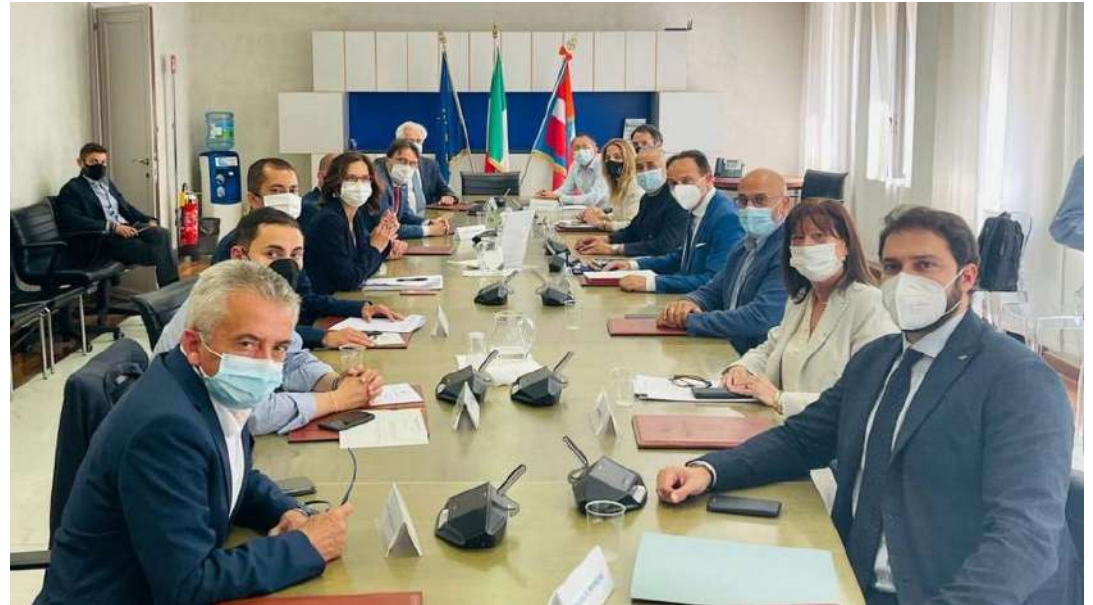
L'incontro della Giunta regionale con il ministro degli Affari regionali, Mariastella Gelmini

Temi sui quali Gelmini ha fornito ampie rassicurazioni: «Siamo di fronte ad una emergenza sanitaria ma anche economica e sociale, e dobbiamo traghettare il Paese fuori da questa crisi. Sarà mia cura fare in modo che i progetti del Piemonte, raccolti nel documento che mi è stato consegnato, trovino cittadinanza all'interno del Pnrr. L'obiettivo è la ripresa econo-