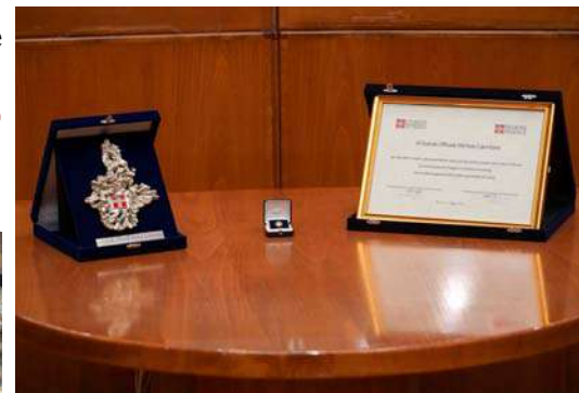
Il Sigillo della Regione Piemonte ed il diploma che sono stati conferiti a Michele Colombino