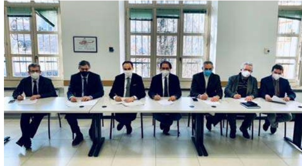
Il Piemonte è tra le prime Regioni a siglare questi accordi

in modo capillare tutti i cittadini e in particolare le fasce più fragili. Il Piemonte ci crede e sta mettendo il suo massimo impegno, perché prima vaccineremo tutti e prima usciremo da questa grave crisi». L'assessore Icardi: «Abbiamo sempre sostenuto che questa battaglia possiamo vincerla solo insieme ai medici di base, che per la vaccinazione antinfluenzale sono stati in grado in meno di due mesi di vaccinare in Piemonte un milione di persone. Questo accordo viene coperto con risorse regionali, ma la Commissione Salute della Conferenza delle Regioni, che coordina, chiederà al ministro Speranza che questa attività sia finanziata, perché è forse la più importante che l'emergenza Covid abbia messo in evidenza. La squadra con i medici di famiglia, e fra poco anche con i farmacisti, sono certo che sarà vincente».