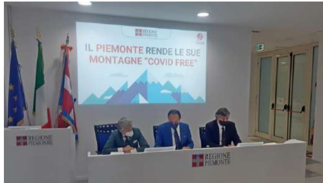
Vaccinazioni per residenti e lavoratori in tutti i Comuni montani piemontesi sono state annunciate nella video conferenza stampa

L'intervento riguarderà innanzitutto i Comuni montani del Piemonte individuati a "priorità alta" (oltre 200 sui 500 totali) in base alla combinazione di parametri che riguardano l'altitudine, la distanza dall'ospedale più vicino e l'omogeneità territoriale (sulla base del criterio richiamato nella circolare nazionale del generale Figliuolo). In particolare: nelle aree alpine, in tutti i Comuni sopra i 700 metri di altitudine e quelli tra i 600 e i 699 metri che distano più di 25 minuti da un ospedale; nelle aree appenniniche e di alta collina, come la Langa cuneese o astigiana, in tutti i Comuni sopra i 500 metri di altitudine e quelli fra i 400 e i 499 metri che distano più di 25 minuti da un ospedale. La mappa è stata definita sulla base delle tempistiche per raggiungere un ospedale elaborate dal 118. Non sono inclusi i Comuni montani che si trovano a meno di 25 minuti da un ospedale. Di concerto con il territorio e le Asl sarà possibile valutare eventuali casi di comuni a "priorità media" che per ragioni specifiche sono da ritenere a "priorità alta".