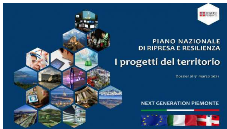
Al via il confronto con il Governo sul «Next Generation Piemonte»

Il Recovery Plan in sintesi. La proposta del Piemonte comprende 1.273 progetti così ripartiti: 672 riguardano la rivoluzione verde e la transizione