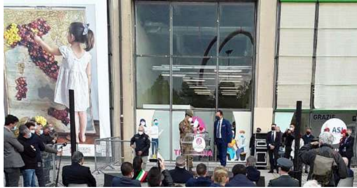
L'inaugurazione del centro vaccinale del Lingotto di Torino

«Il Piemonte è attrezzato per arrivare a fine aprile a inoculare 40.000 vaccini ogni giorno e la Regione sta seguendo il piano vaccinale - ha dichiarato il generale -. Vedendo questo centro sono convinto che si possa raggiungere l'obiettivo. Non abbiamo solo tagliato un nastro, ma visto una capacità che funziona». Figliuolo ha poi garantito che «i vaccini arriveranno e si deve andare spediti. Poco fa il premier Draghi mi ha detto che in questo trimestre giungeranno a livello europeo 50 milioni di dosi extra di Pfizer, che si aggiungeranno a tutte quelle che sono già in arrivo. A fine aprile l'Italia ne avrà 670.000 in più. Dobbiamo vaccinare tutti e presto, arrivare quanto prima a mettere al sicuro gli anziani e i più deboli, e così far ripartire l'Italia. Su Johnson&Johnson stiamo aspettando fiduciosi cosa dirà la comunità scientifica, in particolare E-ma ed Aifa, e rispetteremo chiaramente le prescrizioni. Questo vaccino è stato fermato dagli Usa per una riflessione