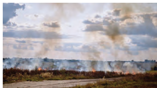
I sindaci potranno decidere delle deroghe

Il divieto di abbruciamento di materiale vegetale, nel periodo compreso tra il 1° novembre e il 31 marzo dell'anno successivo, potrà essere derogato, limitatamente alla combustione dei residui colturali, per un massimo di trenta giorni anche non continuativi per i Comuni montani e per un massimo di 15 giorni anche non continuativi per le aree di pianura. Le deroghe vanno decise dai sindaci con propria ordinanza, fermo restando i limiti posti dal decreto legislativo 152/2006, che all'art.182 prevede che i Comuni e le altre amministrazioni competenti in materia ambientale abbiano in ogni momento la possibilità di sospendere, differire o vietare l'abbruciamento delle sterpaglie in tutti i casi in cui sussistano condizioni meteorologiche, climatiche o ambientali sfavorevoli, con particolare riferimento al rispetto dei livelli annuali delle polveri sottili. Lo hanno deciso martedì 18 febbraio la Terza e la Quinta commissione consiliare, che, riunite congiuntamente in sede legislativa, hanno approvato una nuova legge, frutto dell'accorpamento di due proposte presentate una dalla Giunta e l'altra da un gruppo consiliare, che introduce questa possibilità per gli enti locali.