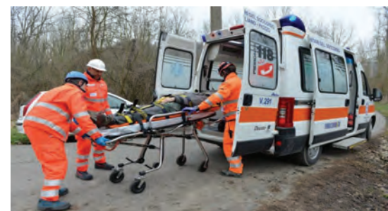
Nuove tecnologie per i soccorsi del 118

Trasmettere immagini via telefono dal luogo di un incidente alla centrale operativa ed essere guidati nelle prime, a volte essenziali, operazioni di soccorso è quanto consen-