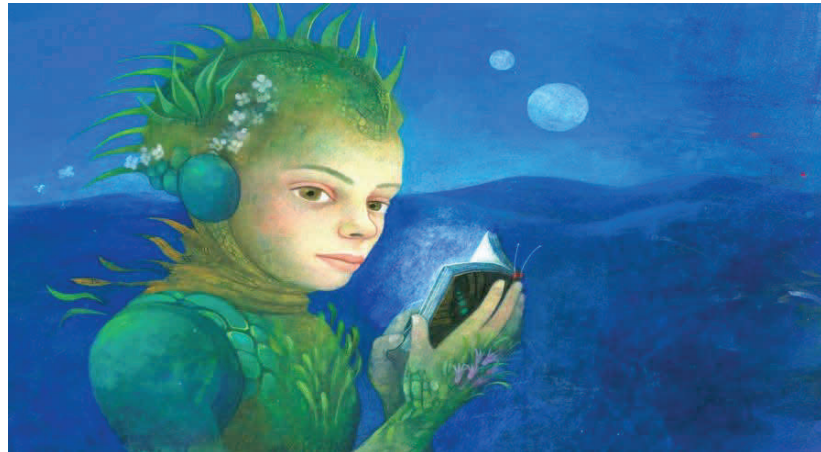
Il manifesto del 33° Salone del Libro, curato dall'illustratrice Mara Cerri

La presenza della Regione Piemonte. Il Salone del Libro anche nel 2020 rappresenta uno dei momenti di punta dell'attività culturale della Regione Piemonte e questa edizione porta con sé due importanti ricorrenze: il 50° anniversario dell'istituzione della Regione Piemonte e il 15° anniversario della promulgazione dello Statuto regionale. In occasione di questo importante anniversario, che