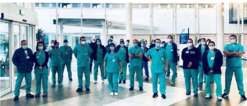
La delegazione israeliana che ha prestato la sua opera all'ospedale di Verduno