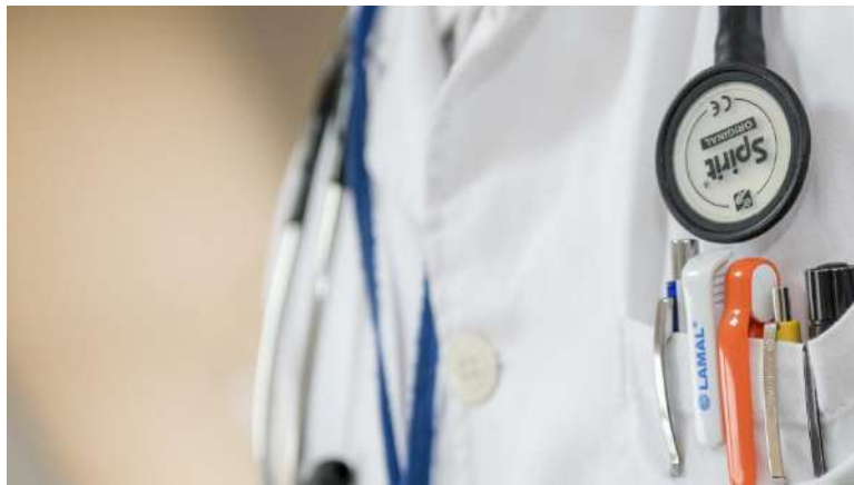
La Regione Piemonte riorganizza la medicina territoriale

All'assistenza primaria viene assegnato il ruolo cardine dell'assistenza territoriale, potenziando le attuali forme associative di gruppo e di rete della medicina generale. I medici che sceglieranno di lavorare in una di queste due modalità potranno essere supportati da personale di studio: il 60% potrà disporre di personale di segreteria (oggi è il 43%) e il 40% personale infermieristico (oggi siamo al 19%). Questo perché la modalità di lavoro in gruppo consente maggiori sinergie ed economicità di scala (per esempio permette di sommare i singoli rimborsi per personale di studio e infermiere e di suddividere le varie spese) e nel contempo la maggior soddisfazione per i cittadini, che trovano così un'offerta di prestazioni allargata, comprese le proposte di medicina proattiva, e un medico disponibile per più ore mattina e pomeriggio. Nei territori molto ampi, con popolazione scarsa e ambulatori medici più dispersi, invece, la scelta migliore potrà essere la medicina in rete, che