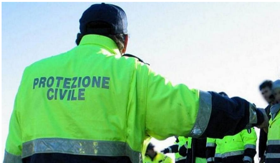
A Bruxelles si è dibattuto del rafforzamento del Meccanismo europeo di Protezione civile

Il presidente della Regione Piemonte, in qualità di componente del Comitato europeo delle Regioni, ha presentato a Bruxelles il parere di cui era stato incaricato nel giugno scorso, sul rafforzamento del Meccanismo europeo di Protezione civile. Nella sua relazione ha dichiarato che la pandemia che ha investito il mondo e cambiato gli stili di vita ha messo in luce, come ogni esperienza estrema, punti di forza e punti di debolezza dei sistemi sanitari, ma anche della capacità di risposta alle emergenze su vasta scala. Il rafforzamento delle capacità di coordinamento previste dalla proposta di modifica del Meccanismo europeo di Protezione civile sono di conseguenza, oltre che opportune, fortemente necessarie sia per intervenire con prontezza ed efficacia quando una crisi è in atto, ma ancor più per mitigarne gli effetti con tempestività. Il parere del Cdr va proprio in questa direzione: rendere lo strumento ancora più efficace e rispondente alle esigenze dell'Europa intera, a partire dalla valorizzazione delle