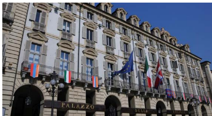
La decisione è stata accolta con soddisfazione dalla Regione

La Corte dei Conti ha parificato per la prima volta senza eccezioni il rendiconto generale 2019 della Regione Piemonte. Una decisione accolta con grande soddisfazione dal presidente della Regione, che, ringraziata la Giunta e gli uffici, ha messo in evidenza come questo giudizio, il primo che interviene sull'operato della Giunta da lui guidata da metà anno, ri-