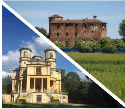
CASINA DI CACCIA LA BIZZARRIA Parco naturale La Mandria (Druento)

I Luoghi del Cuore è la campagna nazionale per i luoghi italiani da non dimenticare promossa dal FAI in collaborazione con Intesa Sanpaolo.