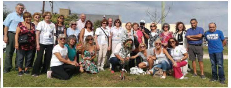
Presentato all'assemblea dell'Ampra a Necochea