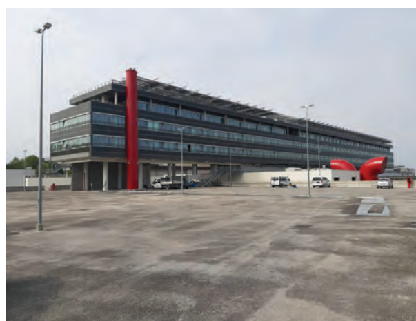
L'ospedale di Verduno (Cn) verrà aperto tra pochi giorni