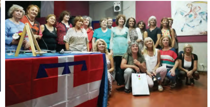
Le donne dell'Ampra. In alto, la piantumazione di una mimosa per i festa della donna. Sotto, la copertina del libro