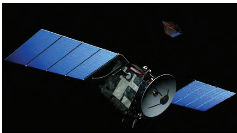
Torino ospiterà la settima edizione di Aerospace & Defense Meetings

Martedì 26 e mercoledì 27 novembre prossimi l'Oval Lingotto di Torino ospiterà la settima edizione di Aerospace & Defense Meetings, l'unica business convention internazionale per l'industria aerospaziale e della difesa in Italia che rappresenta l'occasione per sviluppare nuovi progetti con imprese provenienti da tutto il mondo. L'iniziativa, che vede la collaborazione della Camera di commercio di Torino, fa parte