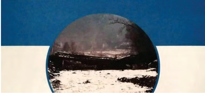
Un Consiglio regionale aperto in ricordo dell'alluvione del 1994

UN FIUME DI RICORDI A 25 anni dalla tragica alluvione in Piemonte