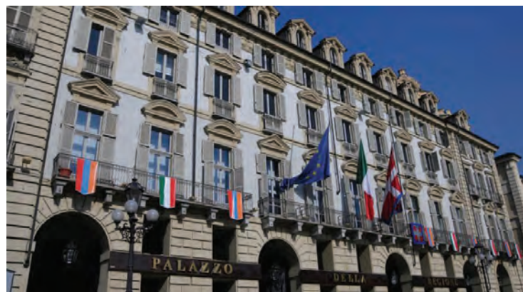
La Giunta regionale si è riunita venerdì 4 ottobre