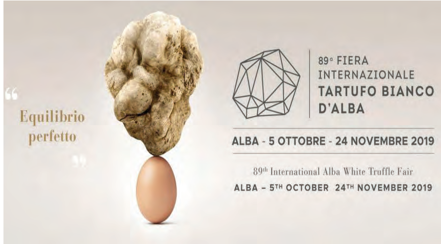
L'edizione numero 89 della Fiera proseguirà sino a domenica 24 novembre

Nel giorno dell'inaugurazione della Fiera, la Giunta regionale ha deliberato il rinnovo della Consulta per la valorizzazione del patrimonio tartufigeno piemontese, i cui componenti sono