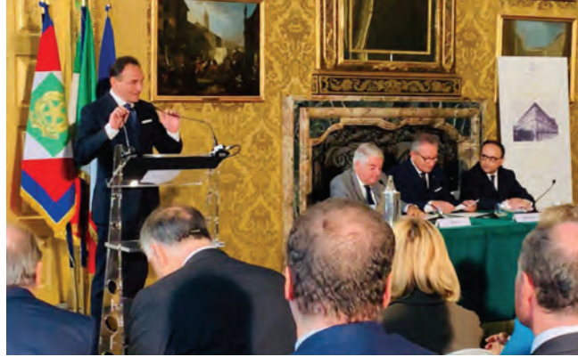
Il Capo dello Stato Sergio Mattarella ha ricevuto dal presidente della Regione Piemonte il drapò, la bandiera regionale. Sopra, l'intervento di Alberto Cirio in tema di autonomie