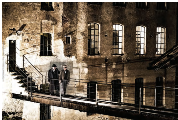
Il 5 e 12 ottobre sui sentieri lungo il torrente Ponzone