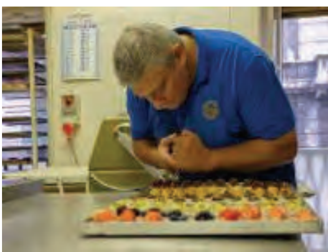
La mostra si può visitare sino a domenica 6 ottobre

Una mostra dedicata alle "Eccellenze Artigiane" di Torino è stata realizzata dalla sezione fotografica del Circolo ricreativo dipendenti comunali di Torino, per celebrare il cinquantenario della propria fondazione. L'inaugurazione avverrà venerdì 4 ottobre, alle ore 21 nella sede del Circolo, in corso Sicilia 12 a Torino. La mostra ha ottenuto il patrocinio della Regione Piemonte e della Fiaf, Federazione italiana associazioni fotografiche. Diciannove le aziende artigiane di eccellenza del capoluogo piemontese si sono rese disponibili per la realizzazione di questi lavori fotografici: i titolari hanno offerto il loro tempo prezioso durante le loro attività e hanno messo a disposizione per la serata del cinquantenario i manufatti di gran pregio che hanno prodotto, affinché possano essere ammirati dai visitatori.