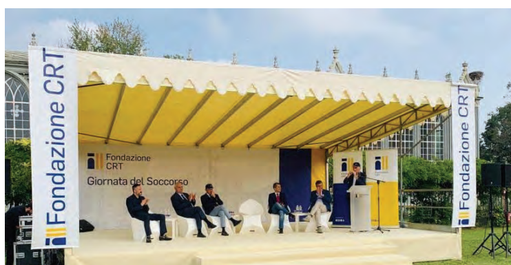
A Racconigi la premiazione delle associazioni vincitrici del bando