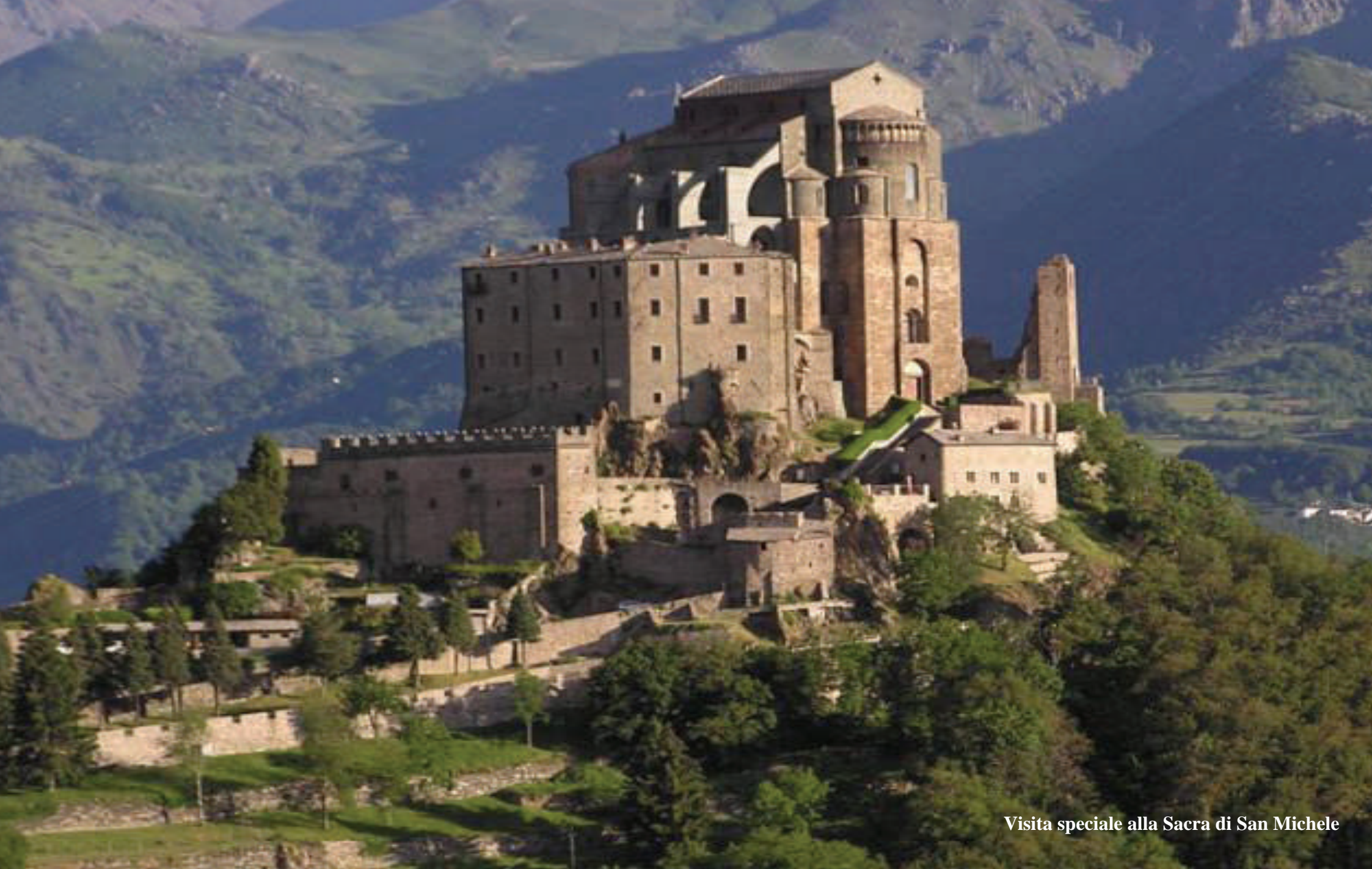
Visita speciale alla Sacra di San Michele

PiemonteNewsletter Supplemento all'agenzia Piemonte Informa