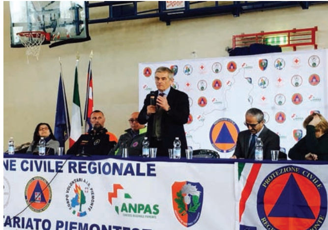
L'intervento del presidente della Regione Sergio Chiamparino

«Sono particolarmente lieto - ha dichiarato Chiamparino - di consegnare questi attestati di riconoscimento agli uomini e alle donne del sistema regionale di Protezione civile e antincendi boschivi. Il Piemonte è un territorio vulnerabile dal punto di vista idrogeologico, cui si ag-