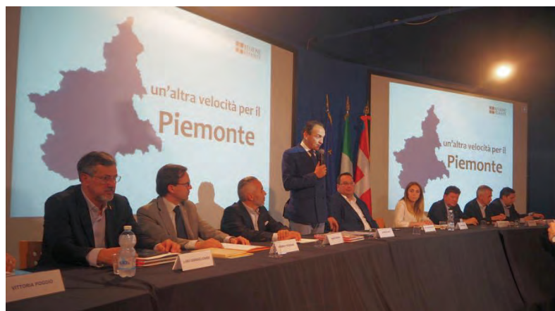
Giunta regionale aperta al mondo del lavoro, venerdì 5 luglio a Novi Ligure

Presente accanto al presidente e alla squadra degli assessori anche il sottosegretario al Lavoro Claudio Durigon: «Lamento l'arroganza di chi non vuole nemmeno prendere in considerazione imprenditori decisi a investire su Perni-