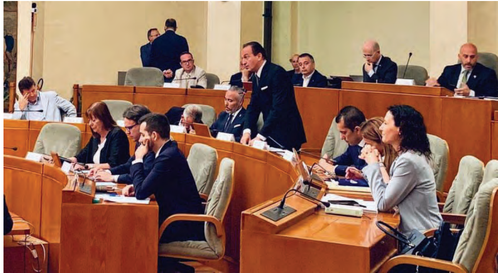
La presentazione del programma di legislatura da parte del presidente Alberto Cirio

Il presidente Cirio è quindi entrato nel merito delle modalità che saranno seguite per dare concretezza a questa