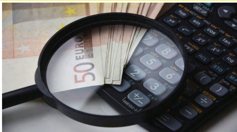
L'udienza di parificazione della Corte dei Conti si è svolta mercoledì 3 luglio

Il presidente ha poi rilevato che «intendiamo dare al termine spending review un'accezione meno negativa. La rivisitazione della spesa non è il taglio delle risorse, ma la capacità di intervenire in modo capillare individuando ciò che serve e ciò che