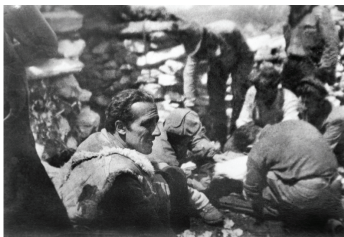
Nuto Revelli partigiano

Nuto Revelli è stato un testimone importante del Novecento: protagonista di battaglie per la giustizia e la libertà, ricercatore "sul campo" della civiltà contadina, osservatore attento e sensibile degli sviluppi di una società in trasformazione. La sua voce risuona forte oggi più che mai, rilanciando parole che non soltanto conservano la carica della memoria (viva e attiva, indispensabile nutrimento per la cultura e la consa-