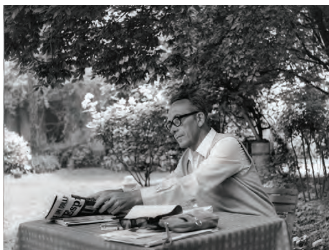
Nuto Revelli a Verduno, nel 1971

Domenica 21 luglio si svolgerà l'iniziativa "Buon compleanno Nuto!" Alle ore 15, nella borgata Paroloup, frazione di Rittana in cui Revelli fu partigiano con la banda "Italia libera", musica e cibi tradizionali