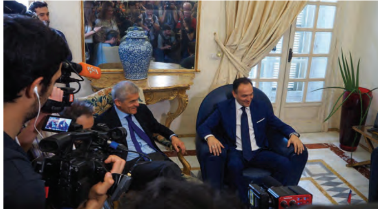
Il presidente Alberto Cirio si è insediato dopo il saluto con l'uscente Sergio Chiamparino, alla presenza di molti giornalisti e fotografi

«Grande emozione. Presto la Giunta e subito al lavoro per il Piemonte»