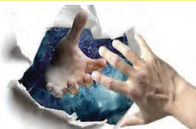
La Giornata nazionale del Sollievo alla sua diciottesima edizione

Città della Salute e della Scienza di Torino, Ospedale Maggiore della Carità di Novara e Ospedale Santi Antonio e Biagio e Cesare Arrigo di Alessandria. All'Istituto di ricerca e cura a carattere scientifico di Candiolo è riconosciuto il ruolo di centro monospécialistico per la terapia del dolore oncologico. La rete di terapia del dolore ha l'obiettivo di migliorare la qualità della vita delle persone adulte affette da dolore, riducendone il grado di disabilità e favorendone la reintegrazione nel contesto sociale e lavorativo. La Rete di cure palliative è operativa, in Piemonte, sin dal 2000: nel 2010, con la promulgazione della legge 38, è stata aggiornata e adeguata. Ad oggi sono operativi 17 hospice, in tutte le province (7 a Torino e città metropolitana, 3 in provincia di Cuneo, 2 in provincia di Alessandria, 1 ciascuno nelle province di Asti, Biella, Vercelli, Novara e Vco). L'hospice accoglie i pazienti affetti da patologie degenerative, che non possono essere seguiti al proprio domicilio, per i quali la terapia attiva non è più appropriata, con lo scopo di prendersi cura anche del paziente inguaribile. Attualmente la copertura è di 200 posti letto per un fabbisogno stimato di 260 posti letto.