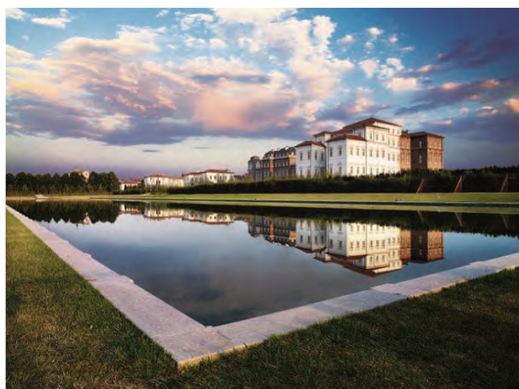
Il Piemonte turistico si è presentato all'Istituto di Cultura di Berlino

L'iniziativa, realizzata in collaborazione con l'Istituto Italiano di Cultura di Berlino, è la