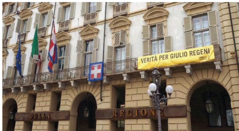
Il palazzo della Regione Piemonte

Formazione continua. Approvate, su proposta dell'assessora al Lavoro e Formazione professionale, due direttive riguardanti il periodo 2019-2021: con 9,9 milioni di euro viene finanziata la formazione continua dei lavoratori occupati mediante l'erogazione di voucher individuali e aziendali per la partecipazione a corsi che saranno inseriti nel Catalogo regionale dell'offerta formativa, in fase di approvazione da parte di Regione e Città metropolitana di Torino per i territori di competenza; con 3,5 milioni si darà continuità alle attività di sostegno e promozione della mobilità transnazionale finalizzata alla formazione delle persone, all'occupazione e allo scambio di esperienze, che comprendono tirocini all'estero per giovani e adulti disponibili sul mercato del lavoro, percorsi formativi transnazionali, visite di stu-