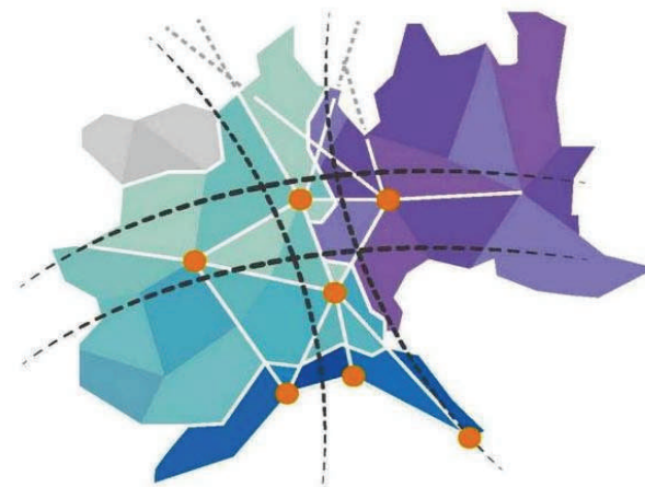
Gli Stati generali della logistica si sono svolti a Milano