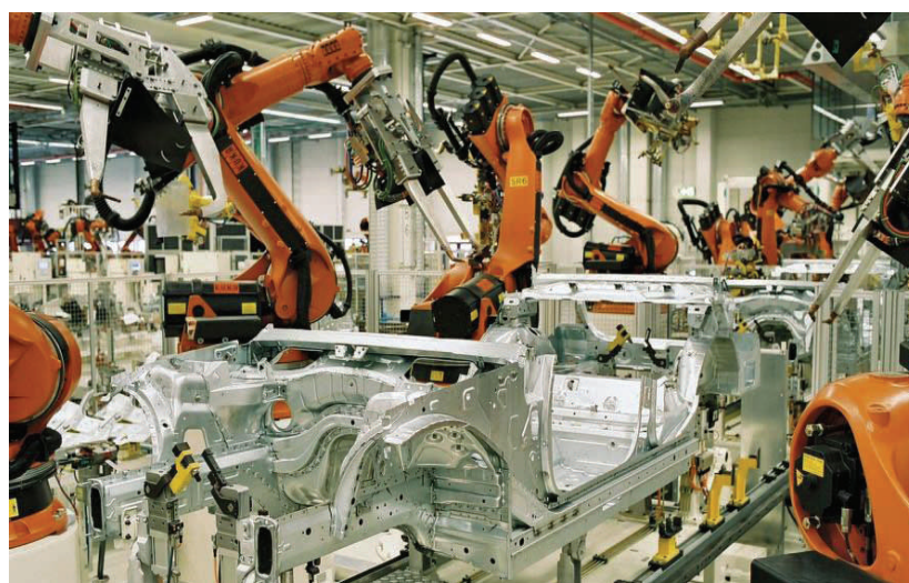
Comunicazione del presidente Chiamparino, in Consiglio regionale, sulla produzione automobilistica

Ha quindi lanciato la proposta di un tavolo permanente: «Penso - ha affermato - che sarebbe estremamente utile se si riuscisse a costituire una sorta di tavolo regionale permanente di coordinamento sul tema dell'automotive in cui Fca sia e si senta coinvolta pienamente, un luogo in cui istituzionalmente sia possibile uno scambio di informazioni sulle azioni reciproche e di coordinamento, senza interferire nei rispettivi ambiti. L'automotive piemontese è un sistema complesso, fatto da una rete di forniture e di subfornitori molto capillare che nel corso degli anni è riuscito a riquilibrarsi e a rilanciarsi come sistema di fornitura dei principali player automobilistici mondiali, tra i più attrattivi sul piano internazionale».