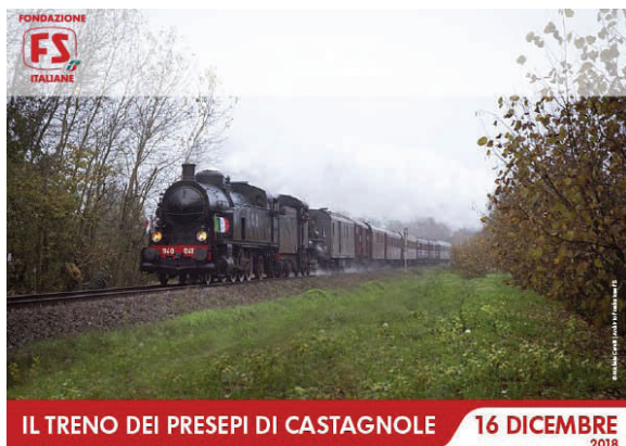
IL TRENO DEI PRESEPI DI CASTAGNOLE 16 DICEMBRE 2018

Sabato 15 dicembre alle ore 16.30 presso il Museo Diocesano San Giovanni di Asti, via Natta 36, inaugurazione della mostra "Presepi Napoletani. Arte, storia, Cultura e Tradizione", a cura dell'Organizzazione di Volontariato "Storici, Artisti e Presepisti Astesi". Il momento inaugurale sarà animato dalla Compagnia Teatrale "I Martin-rock" con il Presepe vivente napoletano. La mostra sarà aperta al pubblico dal 15 dicembre 2018 al 20 gennaio 2019 con il seguente orario: venerdì 15-18, sabato e domenica 9.30-13 e 15-18.