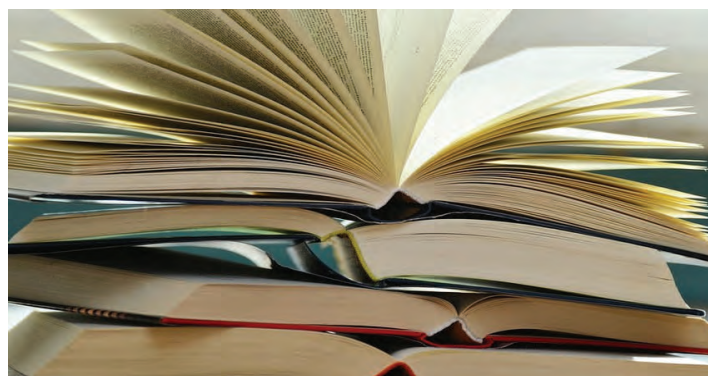
Tanti i provvedimenti compresi nella “Legge Omnibus” appena approvata

Atc. Sono state apportate alcune modifiche alla legge regio-