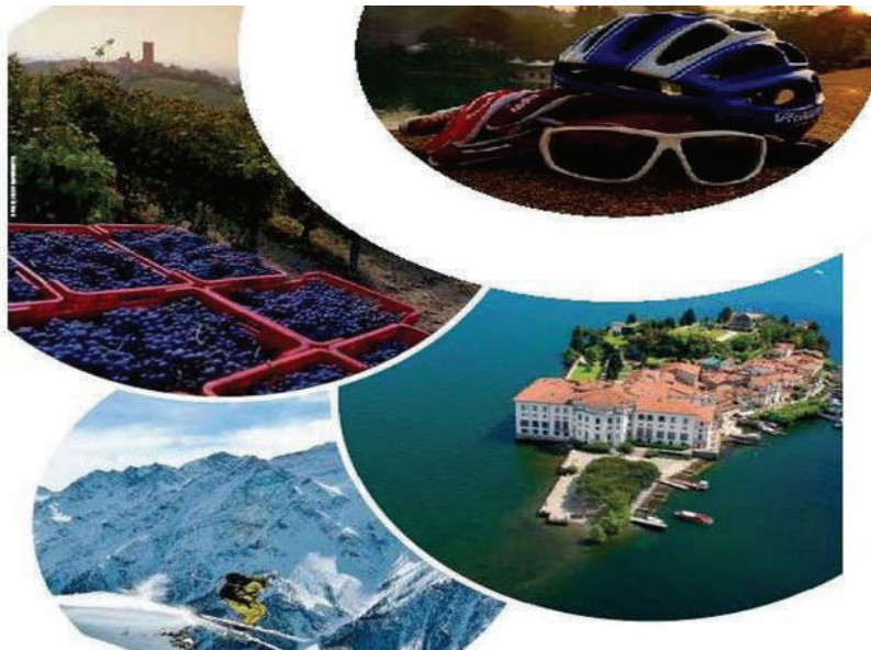
Si sono conclusi al Teatro Regio gli Stati generali del Turismo per il Piemonte

L'incontro è stato l'occasione per presentare il documento di indirizzo per lo sviluppo turistico regionale, frutto di un