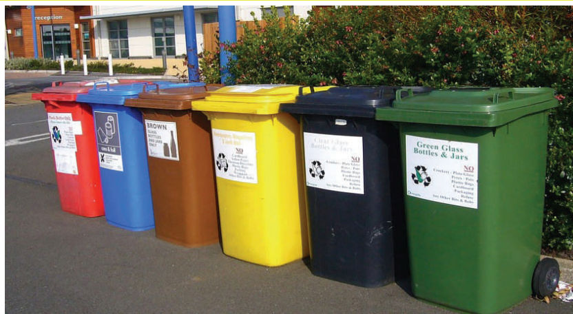
Stanziate dalla Regione 3,6 milioni di euro per la raccolta differenziata porta a porta

Nonostante i dati al 2017 sulla produzione dei rifiuti in Piemonte registrino situazioni confortanti sul migliora-