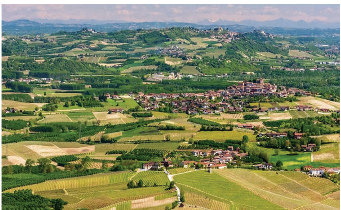
Approvato dalla Giunta regionale il programma che stanziava 83 milioni di euro per gli enti locali

Il programma si sviluppa su quattro linee: ripristino ambientale (3 milioni da destinare ai Comuni come contributo per interventi di rimozione dell'amianto dagli edifici pubblici); edilizia scolastica (4 milioni che verranno ripartiti tra la Città metropolitana e le Province per la ristrutturazione e la riqualificazione delle scuole); cultura e turismo (12 milioni ai Comuni di Torino, Savigliano, Montà, Alba, Chieri, Vercelli, Mango, San Benedetto Belbo, Chiusa San Michele, Castellamonte, Viù, Cavallermaggiore, Benevello, Leriche, Monastero Bormida, Frinco, Revello e Collegno e all'Unione Montana Valle Stura); messa in sicurezza del territorio (48 milioni), che comprende interventi di alta