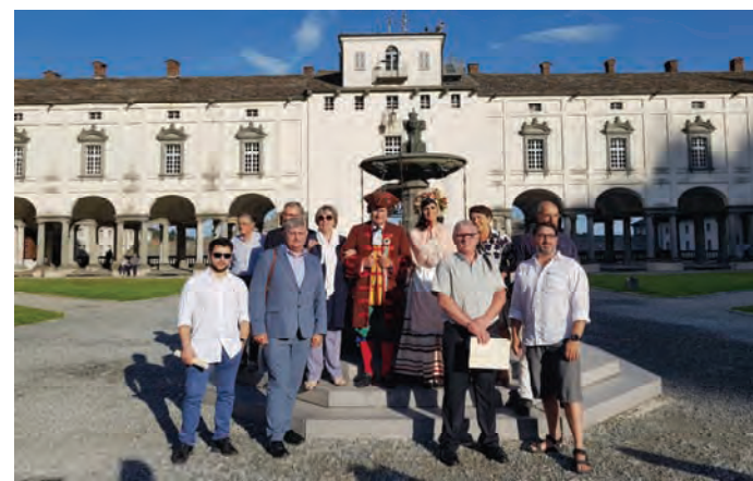
Con un convegno sul cibo a metà luglio al Santuario