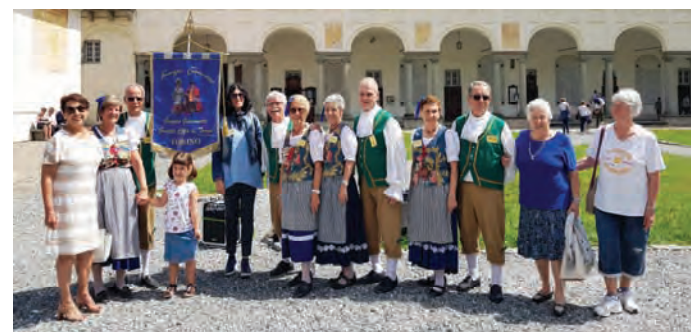
Al Santuario anche Gianduia e Giacometta con varie corali