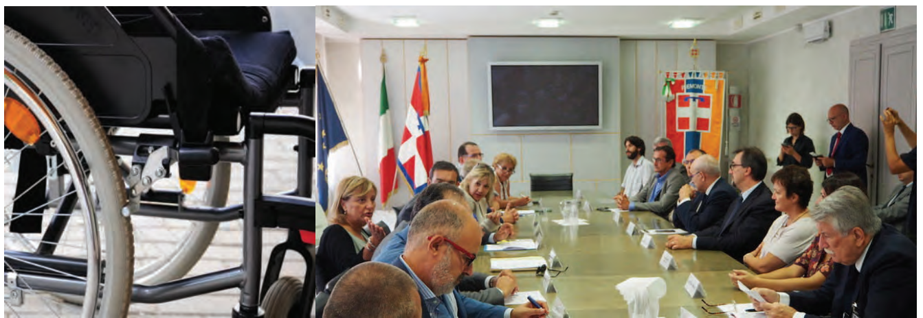
L'accordo è stato sottoscritto mercoledì 12 settembre nella sala Giunta della Regione Piemonte

Agevolare l'inserimento lavorativo delle persone con disabilità, attraverso opportunità d'impiego nelle cooperative sociali. Questo l'obiettivo dell'accordo-