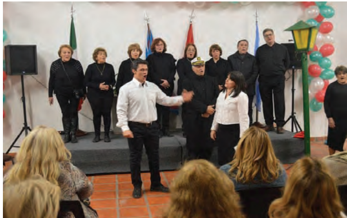
Il momento ufficiale per la celebrazione della ricorrenza sono stati seguiti, domenica 8 luglio, da un pranzo a base di bagna cauda