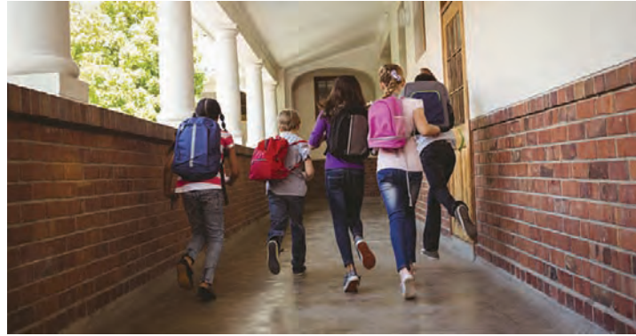
Lunedì 10 settembre ha preso il via l'anno scolastico in Piemonte