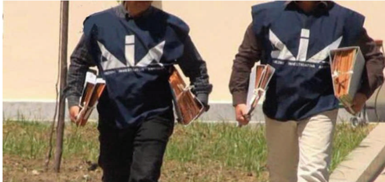
I dati sono forniti dall'Agenzia Nazionale per l'amministrazione e la destinazione dei Beni sequestrati e confiscati alla criminalità organizzata

I Comuni piemontesi assegnatari di beni immobili confiscati alla criminalità organizzata hanno tempo fino alle ore 12 del 28 settembre 2018 per aderire al bando emanato dalla Regione Piemonte per favorirne il riutilizzo a scopi sociali. Gli enti interessati sono 43, così suddivisi su base provinciale: 23 Torino, 1 Alessandria, 4 Asti, 1 Biella, 4 Cuneo, 4 Novara, 3 Vco e 3 Vercelli. Gli immobili confiscati