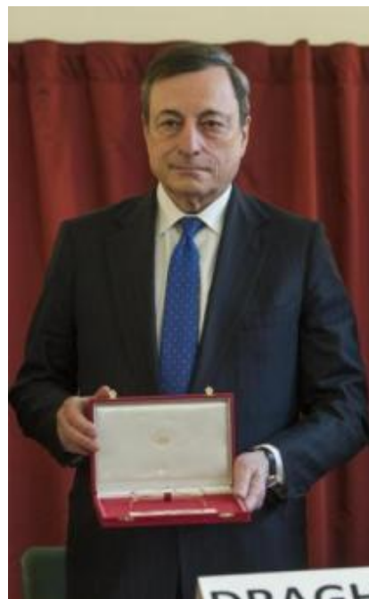
Il ritiro del premio da parte di Mario Draghi