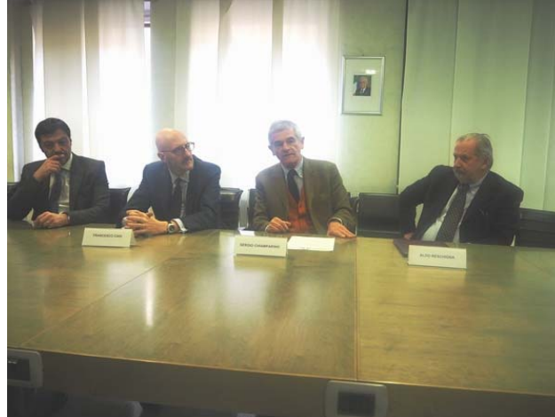
Il protocollo d'intesa firmato venerdì 20 gennaio

Garantire l'attuale presenza capillare di Poste Italiane e migliorare ed ampliare l'offerta ai cittadini valorizzando la rete degli uffici postali in un'ottica di vicinanza, ascolto, prossimità, inclusione e qualità dei servizi è l'obiettivo che si pone il protocollo d'intesa firmato venerdì 20 gennaio a Torino dall'amministratore delegato di Poste Italiane,