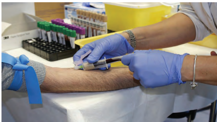
Sarà allargata la sperimentazione avviata dall'assessorato alla Sanità

La figura dell'infermiere di comunità e di famiglia si estende sempre più. Dopo la sperimentazione avviata nel Cuneese, il modello denominato CoN-SENSo, acronimo di Community nurse supporting elderly in a changing society, sarà presto adottato anche in altre realtà del Piemonte. La