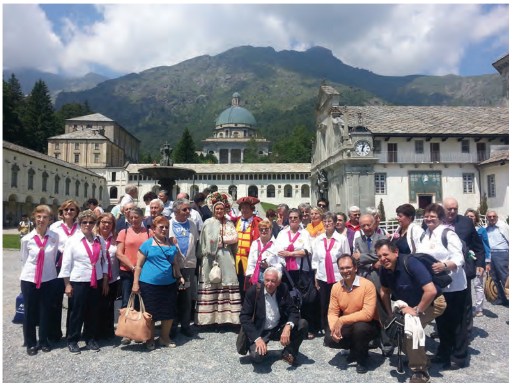
Momenti dell'edizione del ritrovo dei piemontesi del mondo al Santuario di Oropa, svoltasi con grande partecipazione lo scorso anno

Dal 14 al 16 luglio convegno sul tema "Racconti, memorie e speranze di ieri e di oggi"