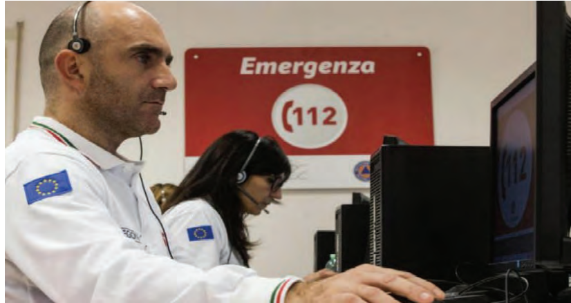
Due le centrali del servizio 112, a Saluzzo (Cn) e Grugliasco (To)

Il numero unico 112 attivo in tutto il Piemonte. Un solo centralino per tutte le emergenze, abbinato ad un numero semplice da individuare e ricordare: con l'estensione anche alle province di Biella e Novara è operativo in tutto